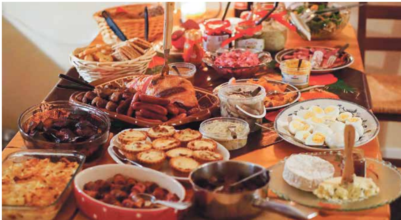
Julbordet i Maria kyrka dignar av hemlagade julfrestelser.